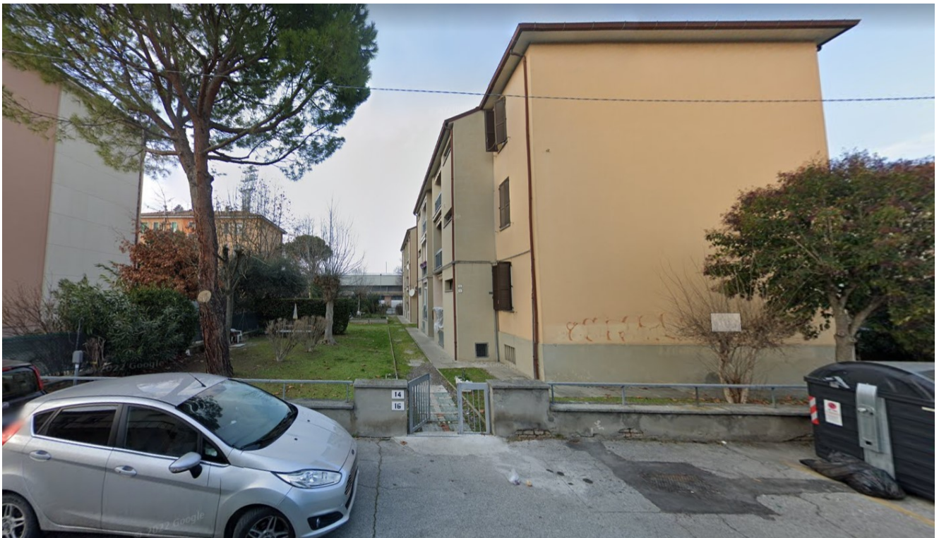
Via Balilla n.16 Ingresso pedonale al Fabbricato

L'ingresso all'edificio si presenta senza particolari barriere architettoniche verticali e vi si accede tramite un vialetto privato in quota con la strada pubblica.