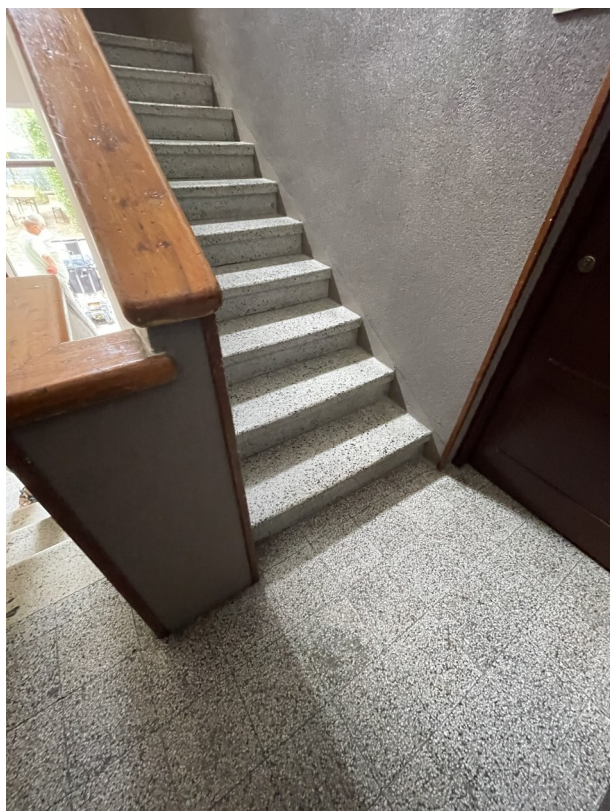
Pianerottolo piano Rialzato a salire