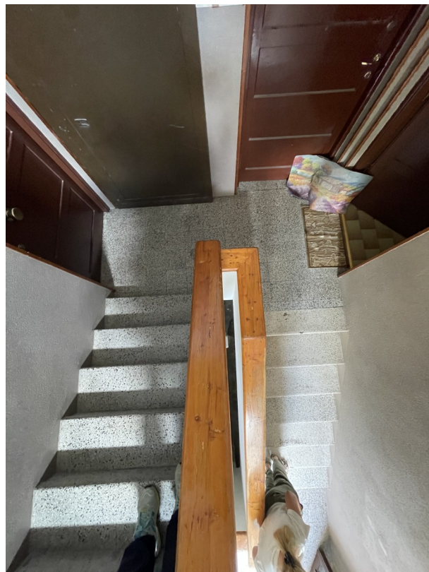
Pianerottolo piano Rialzato con portone blindato montato esterno al muro

Salendo e giungendo al pianerottolo del piano rialzato, troviamo un'interferenza, creata dalla sostituzione di una delle porte d'ingresso originali in legno. La porta installata da un altro condomino, è stata installata in maniera differente dalle porte originali, è un portoncino blindato in metallo montato fuori sagoma rispetto al muro. Questo crea un restringimento del pianerottolo che nel punto minimo si riduce circa a 90 cm nella proiezione con il muretto che funge da parapetto.