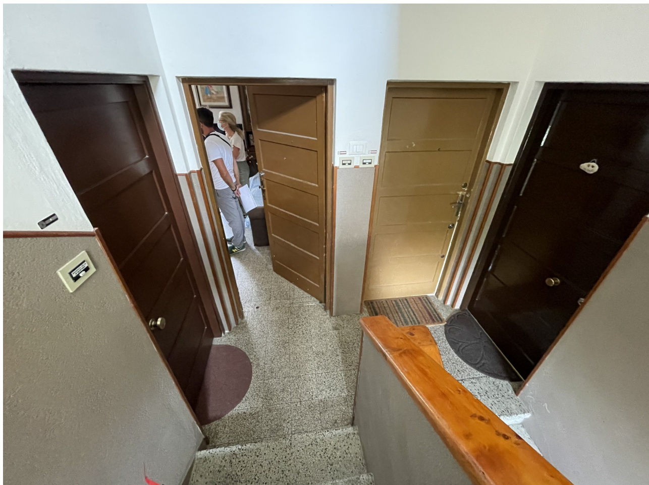
Pianerottolo sul piano d'ingresso all'alloggio dell'Assistita