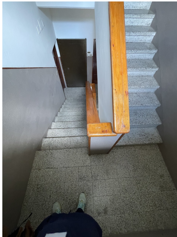
Pianerottolo piano Intermedio a salire